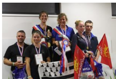
Le podium de l'Amateur 1 Duo.