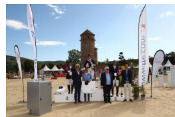
Le podium de l'Amateur 2.