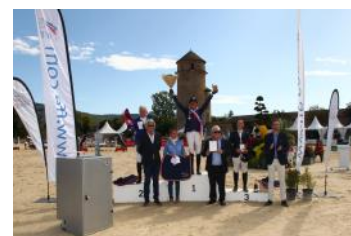
Le podium de l'Amateur 1.