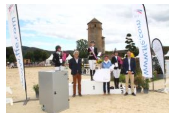
Le podium de l'Amateur 3.