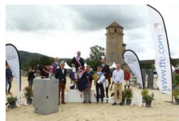
Le podium de l'Amateur 3.