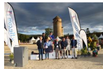
Le podium de l'Amateur 2 Excellence.