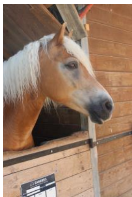
Le cheval par la position de ses oreilles sait faire comprendre à l'homme son humeur.

Si les bienfaits de l'équitation pour les cavaliers ne sont plus à prouver, le bien-être des chevaux domestiqués est également identifiable. Le rapprochement entre les deux espèces est réciproquement bénéfique.