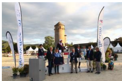
Le podium de l'Amateur Élite.