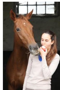
Le cavalier en passant du temps avec sa monture notamment à pied favorise la complicité.