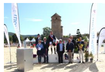
Le podium de l'Amateur 2.