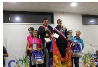
Le podium de l'Amateur 2 Duo.