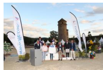
Le podium de l'Amateur 1.