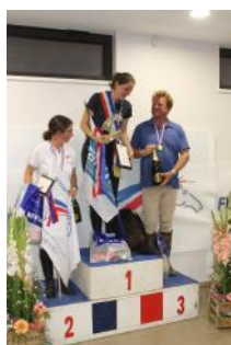
Le podium de l'Amateur 1.