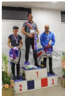
Le podium de l'Amateur Élite.

La Ferme équestre de Wintzenheim organisait le Championnat de France Amateur de TREC les 28 et 29 septembre. Quatre titres ont été décernés. Au total, 65 couples étaient engagés.