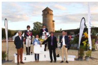
Le podium de l'Amateur Élite.

Le Pôle Équivalée à Cluny organisait du 26 au 29 septembre le Championnat de France Majors de saut d'obstacles et de dressage. Au total, neuf titres ont été décernés. Près de 323 participants étaient au départ.