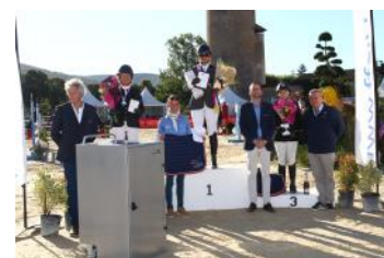
Le podium de l'Amateur 4.