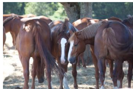
Les moments passés en liberté et avec leurs congénères sont essentiels pour les chevaux domestiqués.

Si l'utilisation du cheval a évolué au fil des siècles, aujourd'hui il est principalement devenu un partenaire de loisir et/ou de compétition pour les cavaliers. Si de prime abord les chevaux peuvent paraître imposants, il suffit d'apprendre à les connaître pour comprendre qu'ils sont bienveillants et consentants. La variété des activités effectuées avec les chevaux n'a cessé d'augmenter toujours dans une optique de bien-être pour eux. Dans la nature, le cheval parcourt quotidiennement plusieurs dizaines de kilomètres. Ces déplacements sont importants pour la circulation des fluides et pour la digestion. Ainsi, il est important de varier les plaisirs. Le travail monté est important mais ne suffit pas. La mise en liberté des chevaux, en groupe de préférence, est recommandée pour leur bien-être. Si l'espace du centre-équestre ne permet pas une mise en liberté au pré, un espace clos comme un manège peut tout à fait convenir.